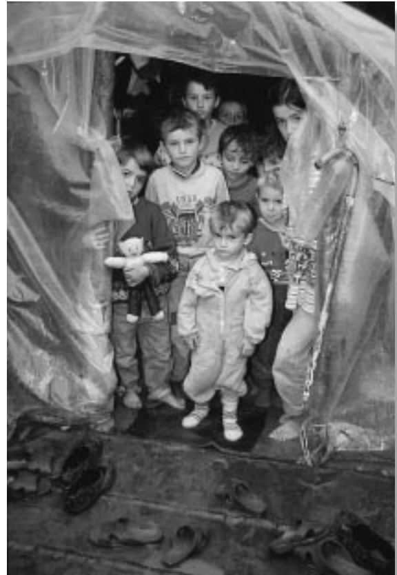
ビニールシートで雨露をしのぐコソボの避難民。厳寒の冬が間近だ。

アルバニア系住民の武装勢力も非常に強くなっている。セルビアから言わせたら「テロリスト」、アルバニア系住民から言わせると「正当な自治を求めての独立運動」。そういう衝突が続いているわけです。約17万人がコソボ内で家を失い、そしてそのうちの少なくとも5万人ぐらいいは山の中に逃げている。バルカンの冬はわり