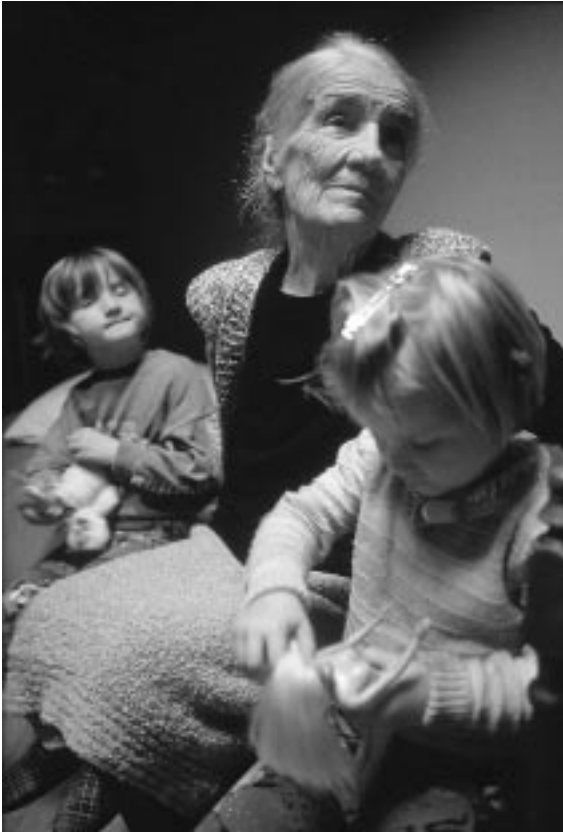
クロアチアのクライナ地方から追い出された人々。年寄りも多い。