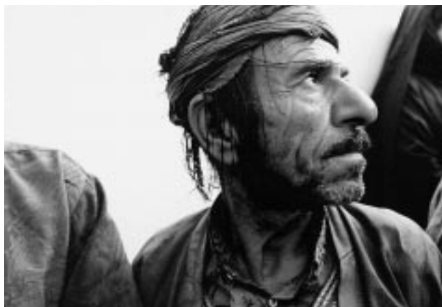
UNHCRテヘラン事務所MRUの診断を待つアフガン難民

依然、イラク政情は安定しない。97年に、クルド人難民の帰還者は、4341名にとどまった。クルド難民は、決して過去の歴史ではない。