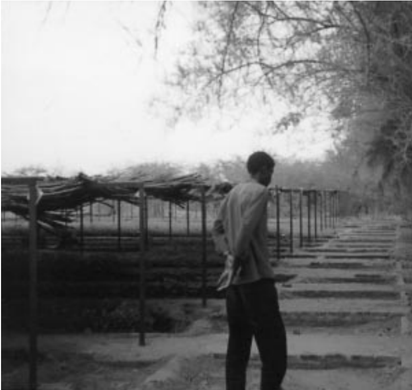
15万本の苗木が育てられた、ショワクの苗木。