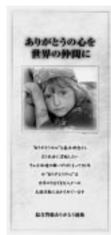
「総合警備ありがとう運動」の パンフレット

設立30周年を迎えた昨年からはUNHCRの援助活動に協力して、300万円の寄付を贈っている。