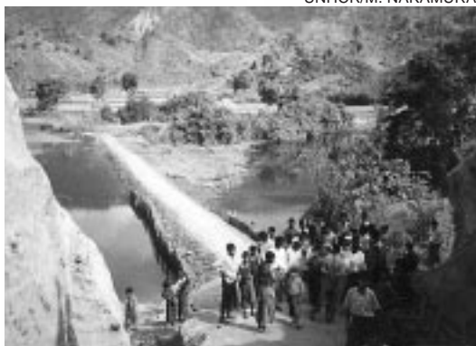
ガンチャン村の簡易ダム。雨季になるとこの堤防は流されてしまう。

り、自転車で村から村を巡った。荷物は移動の度にポーターを雇い、運んでもらう。次の目的地への連絡も、村人を雇って走らせる。5か村を訪ね、7か所で集会を開いた。