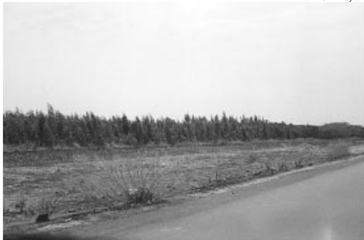
「みどり一本」運動の支援によって育てられた主要道路沿いに広がる再植林地帯。スーダン東部の町ワド・アワド付近。