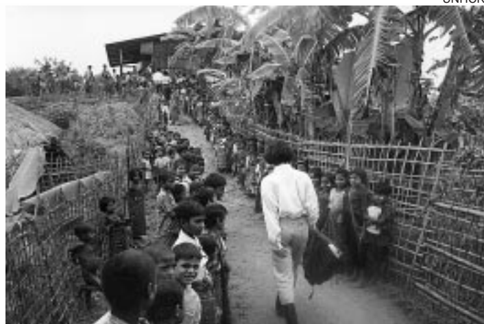
UNHCR 貧しい家庭では、わずかな授業料もはらうことができず、また、子どもたちは大切な働き手でもある。UNHCRは、学校建設や特別講座の開設、登校した子どもの家庭に援助をだすことによって、子どもたちの就学機会を増す努力をしている。開校式で子どもたちの出迎えをつける著者。