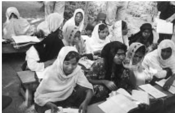
女性のための識字教室。ベンガル方言を母語としているためミャンマー語の会話や生活に欠かせない「数字」から学んでいる。

しかしながら、イスラム系住民はミャンマーには戻ったものの、今なおミャンマー国籍を認められていないという問題がある。そのため、移動・教育・就業などの面で不自由を強いられている。国家の保護を受けられない人々を保護するUNHCRは、まだお役ご免とはいかないようである。