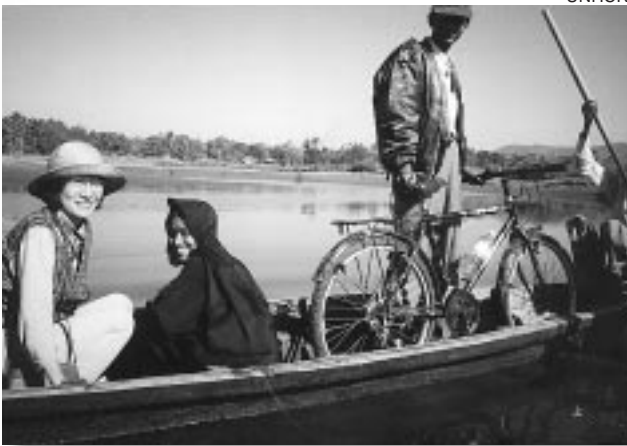
橋のない川では船に自転車を積んで渡る。向かって左端が著者。

現在、アジア地域にいる難民・避難民は約800万人。その中で、少しずつ本国に帰還し、解決に向けて動いているのがミャンマー難民だ。今号では、帰国した人々が故郷で定着し再び難民にならないための援助活動を、日本人職員の取り組みを通して紹介したい。